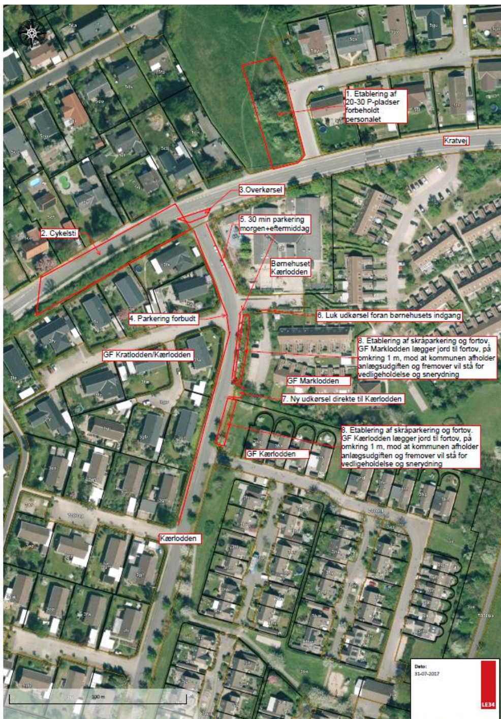
Figur 2: Fælles forslag fra børnehuset Kærlodden og de tre tilstødende grundejer/andelsforeninger